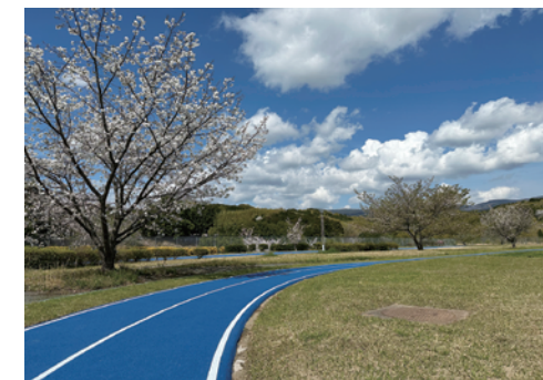
ランニングレーン

静岡県議会にて 総務副委員長、盛土副委員長、議会運営委員会委員、広報委員を拝命しました！