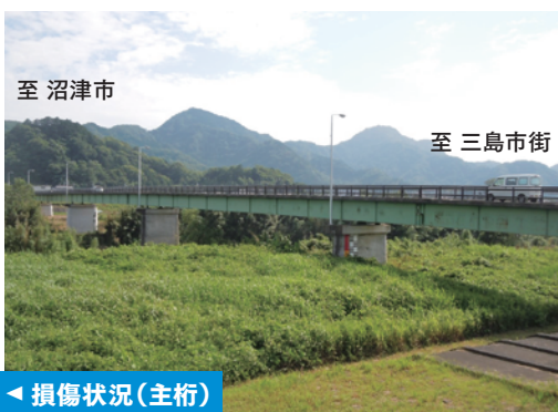
◀ 損傷状況 (主桁)